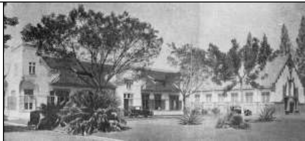
Voorraanzicht botanische laboratoria en museum.

Zoo ontstond in 1887 het Proefstation Oost-Java, als jongste der drie suikerproefstations, waaruit tenslotte het tegenwoordige Proefstation voor de Java-Suikerindustrie is gegroeid. De groote vlucht, welke de suikerindustrie in deze decennia nam, is algemeen bekend. Slechts enkele cijfers ter illustratie daarvan: van 1887 tot 1928 steeg de suikerproductie per hectare van nog geen 70 tot 150 quintalen [100 kg]; de totaal productie van nog geen 400.000 tot bijna 3 miljoen ton.