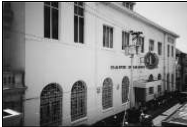
Nederlandsch-Indische Escompto Maatschappij.

NB: In de geveltop de wapens van Semarang en Surabaya. Tevens vestiging van Hoofdkantoor van Rouwenhorst, Mulder & Co., N.V. Exploitatie en Producten Handel Maatschappij. Export van, cacaobonen, citronella olie, copra, droog veevoer, hars, koffie, maïs, oliehoudende zaden, peper, sojabonen, tapioca producten, vezels. Import van: metaal, metaalwaren en gereedschap. Dicht op Chinese feestdagen