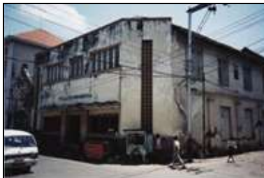
Algemene Verzekering Mij Indische Lloyd.

Links, op de hoek: (nr. 12-14) Naamloos.