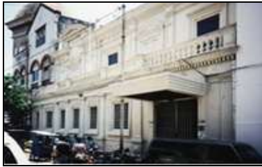
Semarangsche Spaarbank. (1888, Verver)

Op initiatief van de afdeling Semarang der Maatschappij tot Nut van het Algemeen en met steun van de Vrijmetselarij werd in 1853 de Spaar- en Beleenbank opgericht om mensen die in financiële moeilijkheden verkeerden, uit de handen van de woekeraars te houden.